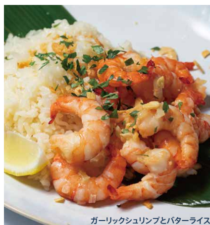
ガーリックシュリンプとバターライス