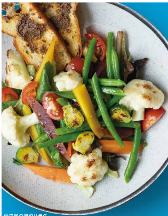
淡路島の野菜サラダ

淡路産の玉ねぎをじっくり炒めた オニオングラタンスープ 800 AWAJI LOCAL ONION GRATIN SOUP