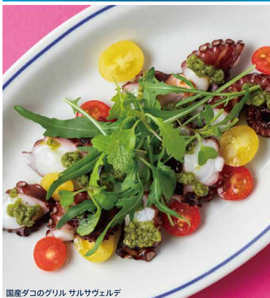
国産ダコのグリル サルサヴェルデ