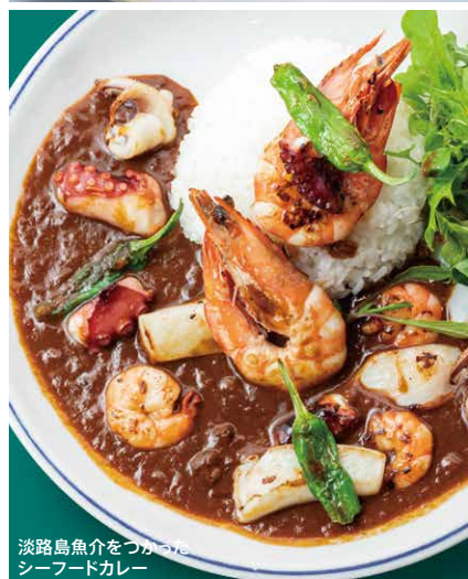
淡路島魚介をつかった シーフードカレー