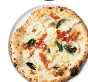
リモーネ エ チポッラ

LIMONE E CIPOLLA レモン、玉ねぎ、セミドライトマト、 モッツアレラ、アンチョビ、バジル、 オリーブ、グラナパダーノ