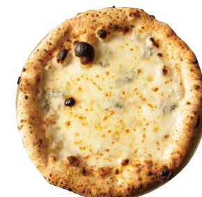
クワトロフォルマッジ

QUATTRO FORMAGGI モッツアレラ、ゴルゴンゾーラ、 タレージョ、リコッタチーズ