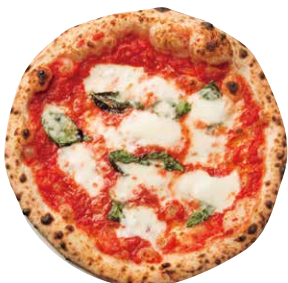
マルゲリータ プロヴォラ

MARGHERITA PROVOLA トマトソース、 燻製水牛モッツアレラ、バジル、 ミニトマト