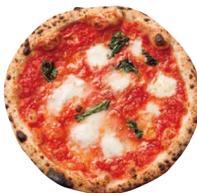
マルゲリータ エクストラ

MARGHERITA EXTRA トマトソース、 水牛モッツアレラ、バジル、 ミニトマト