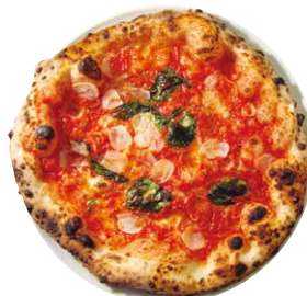
マリナーラ スペチャーレ

MARINARA SPECIALE トマトソース、ミニトマト、 バジル、ニンニク、オレガノ